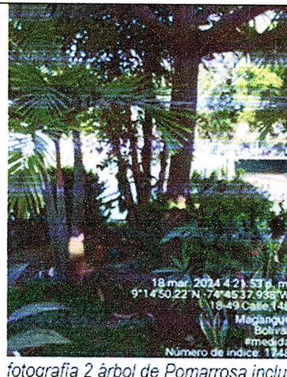
fotografía 2 árbol de Pomarrosa incluido en la so